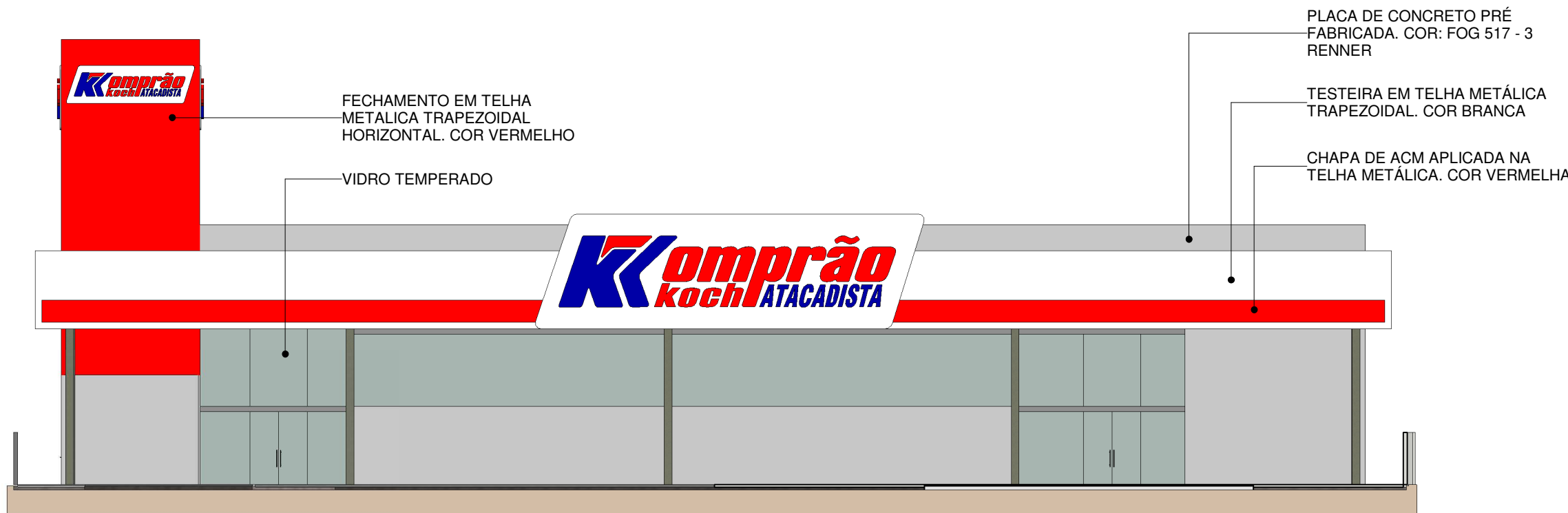
01 ELEVÇÃO 04