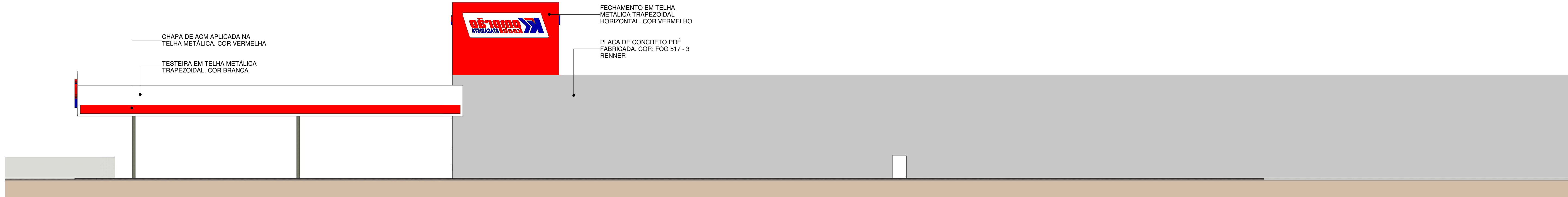
04 ELEVÇÃO 03